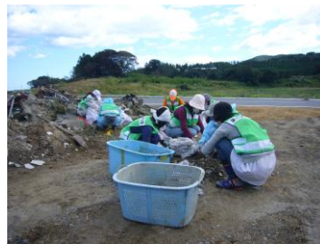
南三陸町でのボランティア活動