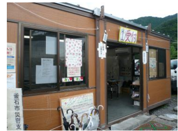
釜石市災害ボランティアセンター