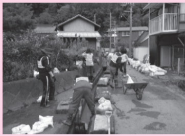
神奈川県共同募金会茅ヶ崎市支会(市社協内)

国内の大規模災害に備えるため、共同募金会では、共同募金寄附金の中から「災害準備金」の積み立てを行っています。 災害準備金は、被災者支援のための炊き出し活動をはじめ、災害ボランティアセンターの設置や避難所の乳幼児保育活動など、さまざま活動資金として使われています。