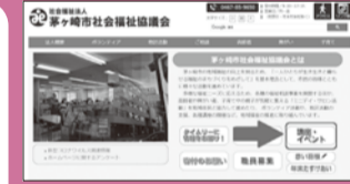
市社協ホームページトップ画面