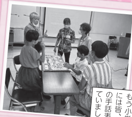
夏休み おやこ手話教室

毎年参加していたお子さんも もう小学校6年生に！最終日 には皆、自己紹介がありました！ の手話表現がしかり身につ ていました！