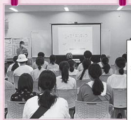
コースボランティア茅ヶ崎2022