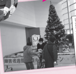
障害者週間街頭キャンペーン