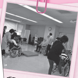
ボランティア大学開講

大人の学び。ボランティアとは？ 車の使い方方々？ ボランティアの第一歩を応援しています。