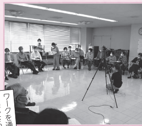
地区ボランティアセンター 連絡会

ワークを通じて、改めてボランティア の楽しさややりがいを実感！ 仲間とのつながり、新たな抱負を手を 交えるきっかけとなりました。