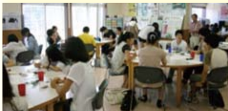
*昨年度のユースボランティア茅ヶ崎の様子

ので、ボランティア活動に興味をお持ちの方、ボランティアの依頼を希望される方、どうぞお気軽にご利用ください!