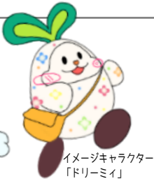
イメージキャラクター 「ドリミー」